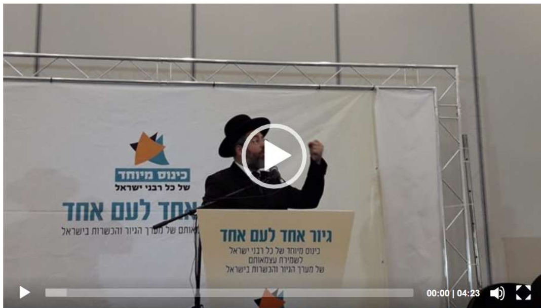
להכל יש רשות אחראית ורק הרבנות הפקר?

הרב הראשי לשעבר, הרב ישראל מאיר לאו, מותח ביקורת חריפה על רפורמת הגיור והניסיונות להחליש את הרבנות בישראל.