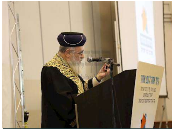
הראשל"צ הגר"י יוסף בנאומוצילום: באדיבות המצלם

ארי קלמן, ז' אב תשע"ח 19/07/2018 09:03 תגיות: