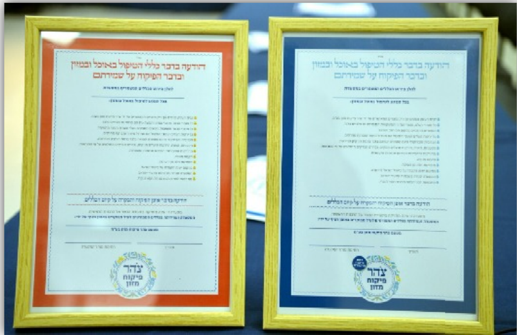
תעודות הכשרות של צהר

תארו לכם שמישהו היה מציע להפריט, עד הסוף, את תקציב הביטחון, להרגשה הטובה של האזרחים. 70 מיליארד ש"ח יחולקו בין 3 מיליון (בתי אב, נושאי נשק מה שתרצו). זה יאפשר לתת לכל אחד שני אקדחים ושלושה רובים.